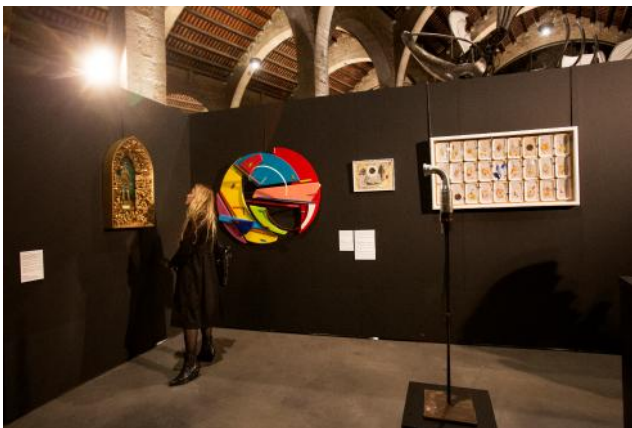
Vista general de l'exposició