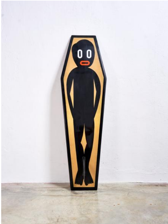
Boris Hoppek, Surf Coffin , cara A