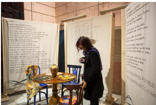
Una altre món és possible de Neret Art Social

Les activitats realitzades durant l'any s'han contribuït a creat noves xarxes de col·laboradors, noves col·laboracions i intercanvis, tant al barri, a la ciutat, a l'estat i també internacionals i han atret noves sòcies i socis i nous artistes emergents.