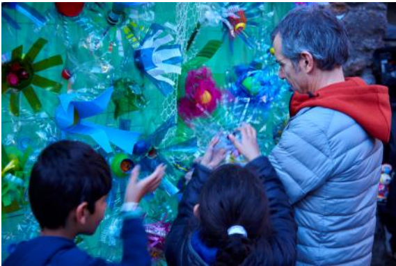
El Jardí Vertical

Amb la intenció d'ampliar la xarxa d'artistes, creadores, dissenyadors i artesans vinculats a Drap-Art, de donar a conèixer el treball social, educatiu i transformador dels artistes tant a la ciutat de Barcelona, com a Catalunya, la resta de l'Estat i a nivell internacional, vam realitzar diverses activitats durant tot l'any: