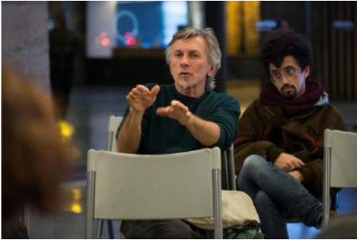
Presentació de llibre i debat