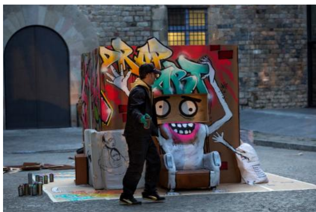
Art urbà en viu