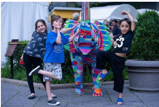
Three Rivers Arts Festival

- Mercat Drap-Art de Reciclatge artístic i Consum Sostenible i tallers de reciclatge creatiu a la Plaça Reial. Aquest any Drap-Art va poder oferir un lloc d'exposició i punt de venda a més de 20 artistes, dissenyadors i artesans associats, durant 32 dissabtes de l'any. A més a més cada dissabte de mercat es va oferir un taller de reciclatge creatiu gratuït pel veïnat.