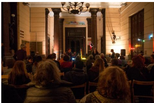
Concert de la Eli Gras al Borsí

- Drap-Art participa al Social Film Festival al Arts Santa Mònica, realitzat pel Skepto Film Festival, la Sardènia Film Commission i l'Escola Bau. Una mostra de cine mediambiental i col·loquis sobre disseny sostenible i innovador.