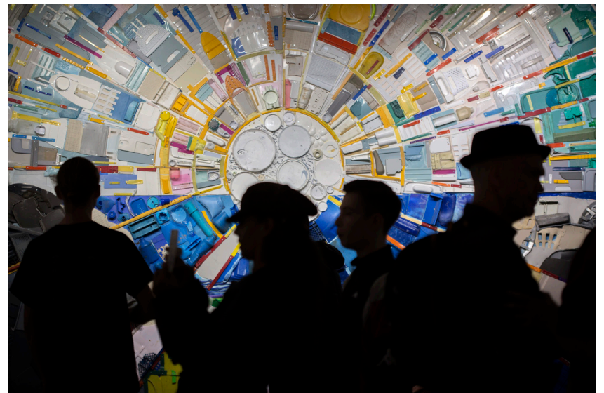
Drap-Art'16 Inauguració Drap-Art'22, Galeries Villa de Arte