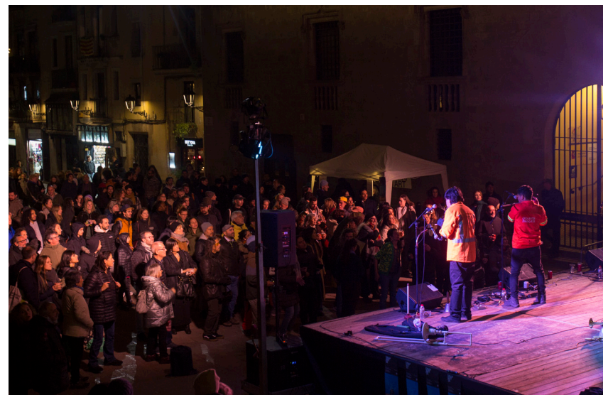
BIN , Veivi Jesus Orkestra, Marató, 1996 Concert inaugural a la Rambla, 2025